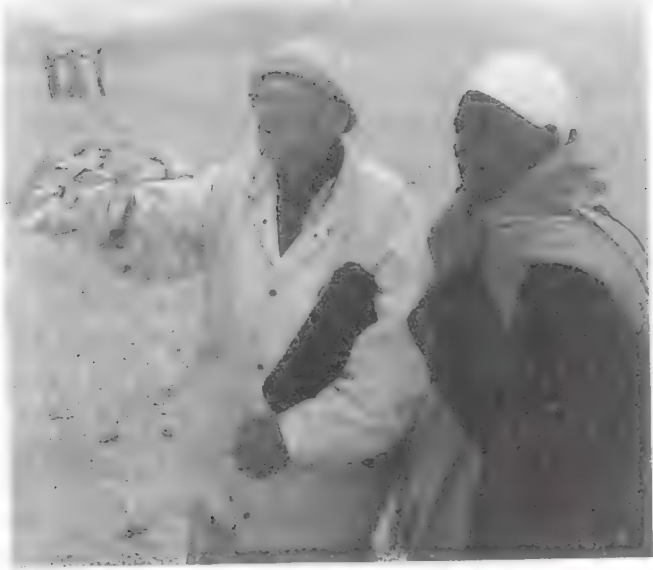
لویر مع أحد رؤساء عماله